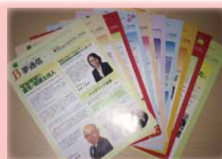
バックナンバーはWBCホームページ上で配信しております。

次の広報委員会メンバーに期待しつつも、既発行の夢通信を読み返し少し寂しい気持ちになる現メンバーでした。新メンバーによる夢通信も、どうぞよろしく願いいたします！