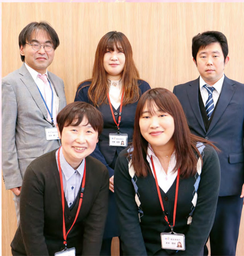
上左：広報委員会委員長 上中：コミュニケーション委員会委員長 上右：研修委員会委員長 下左：環境美化委員会委員長 下右：朝礼委員会委員長